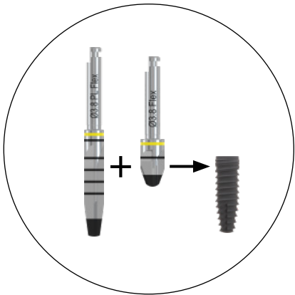
Im krestalen Knochen muss die Aufbereitung standardmäßig durch den Profilbohrer erfolgen, um Kompressionen des Knochens zu vermeiden.